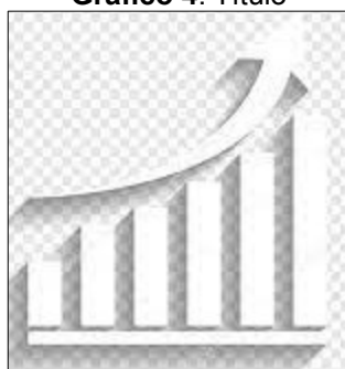
Gráfico 4. Título

4 Texto. Texto. Texto. Texto. Texto. Texto. Texto. Texto. Texto. Texto. Texto. Texto. 5 Texto. Texto. Texto. Texto. Texto. Texto. Texto. Texto. Texto. Texto. Texto. Texto. Texto. 6 Texto. Texto. Texto. Texto. Texto. Texto. Texto. Texto. Texto. Texto. Texto. Texto. Texto. 7 Texto. Texto (Gráfico 4).