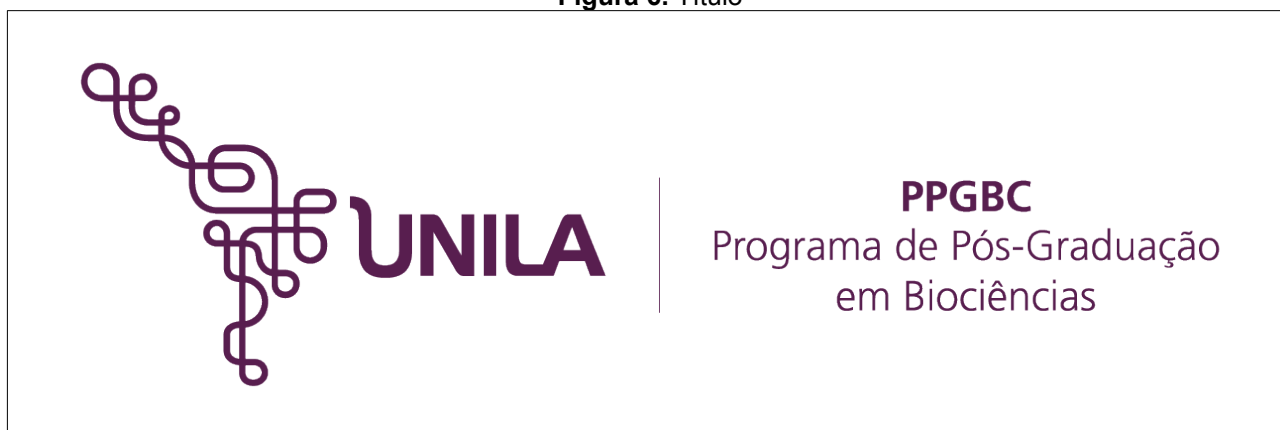
Figura 6. Título

2 Texto. Texto. Texto. Texto. Texto. Texto. Texto. Texto. Texto. Texto. Texto. Texto. 3 Texto. Texto. Texto. Texto. Texto. Texto. Texto. Texto. Texto, conforme Figura 6.