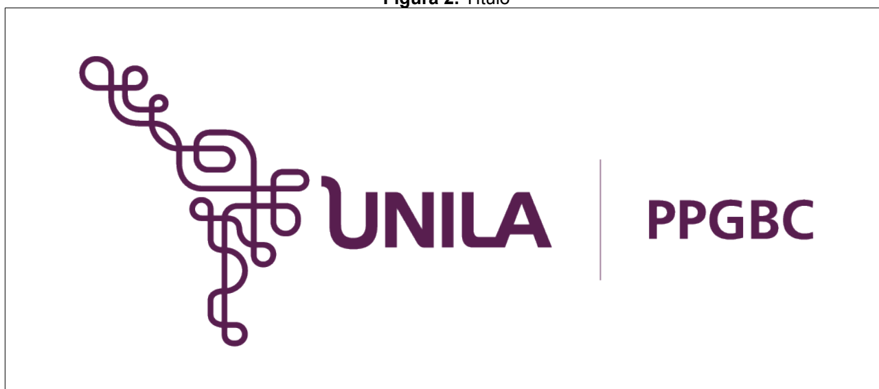
Figura 2. Título