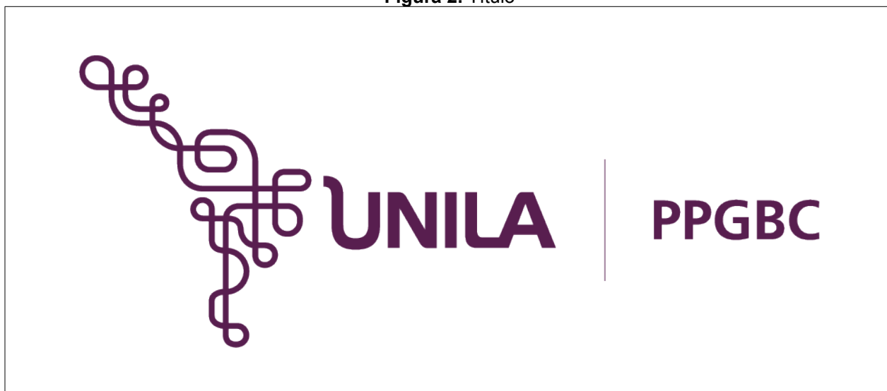
Figura 2. Título