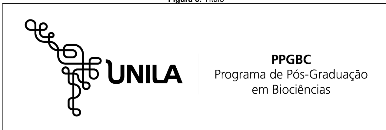
Figura 3. Título