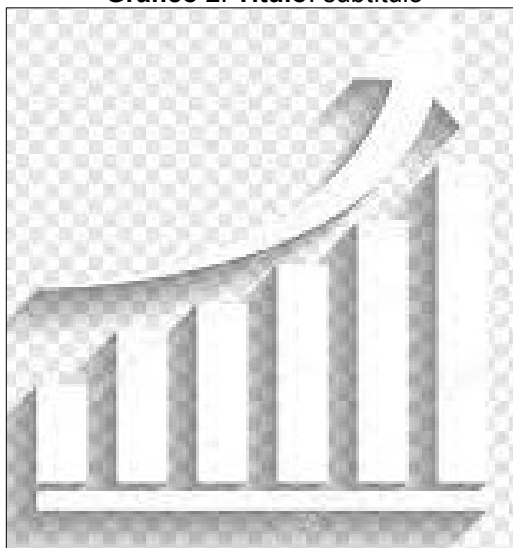
Gráfico 2. Título: subtítulo