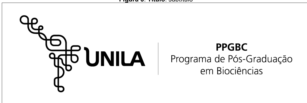
Figura 3. Título: subtítulo

3